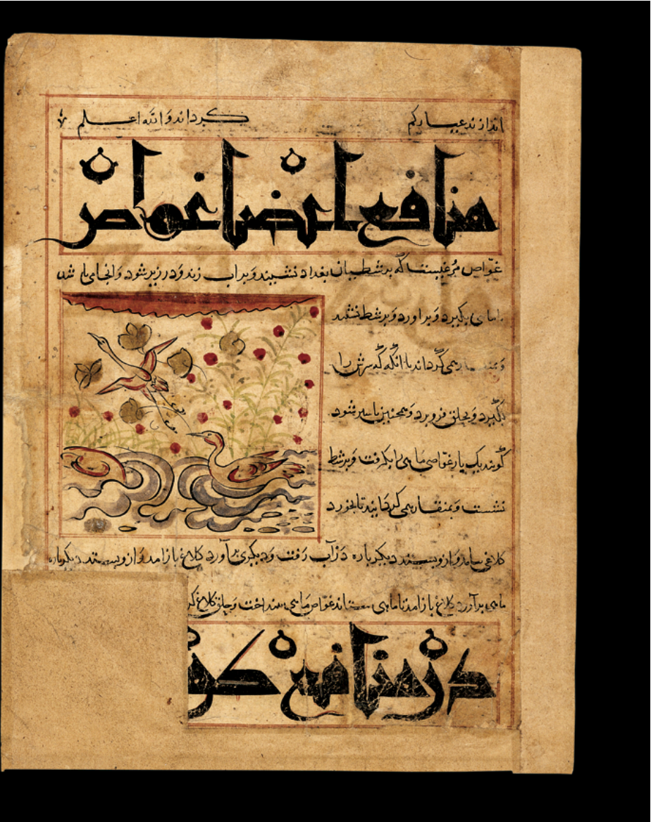
Folio from Usefulness of Animals, Green Magpie