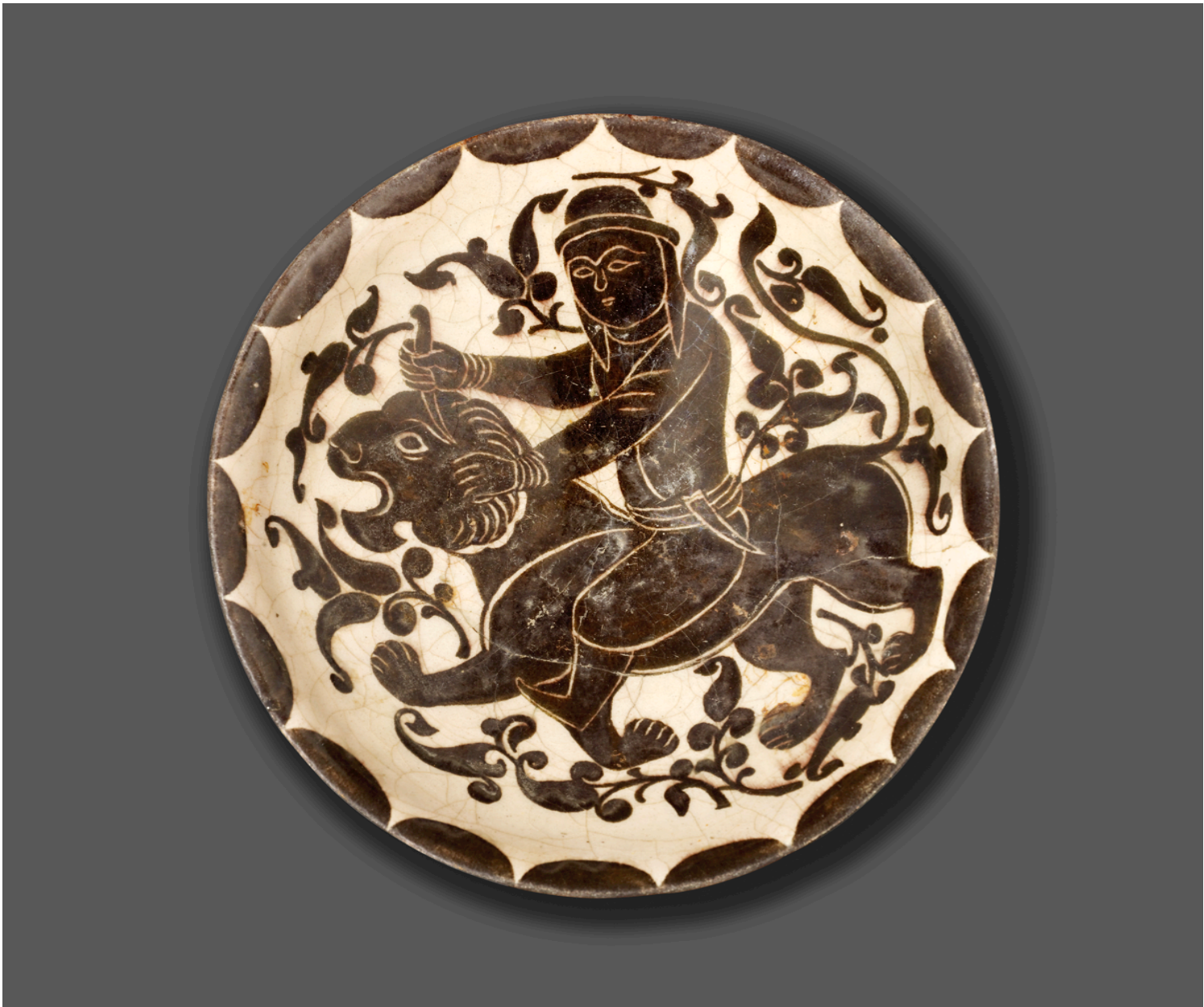
Bowl With Man Stabbing A Lion