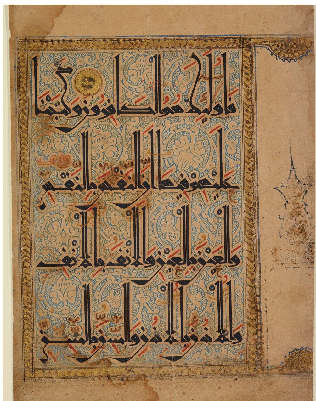
Folio from Qarmathian Qur'an